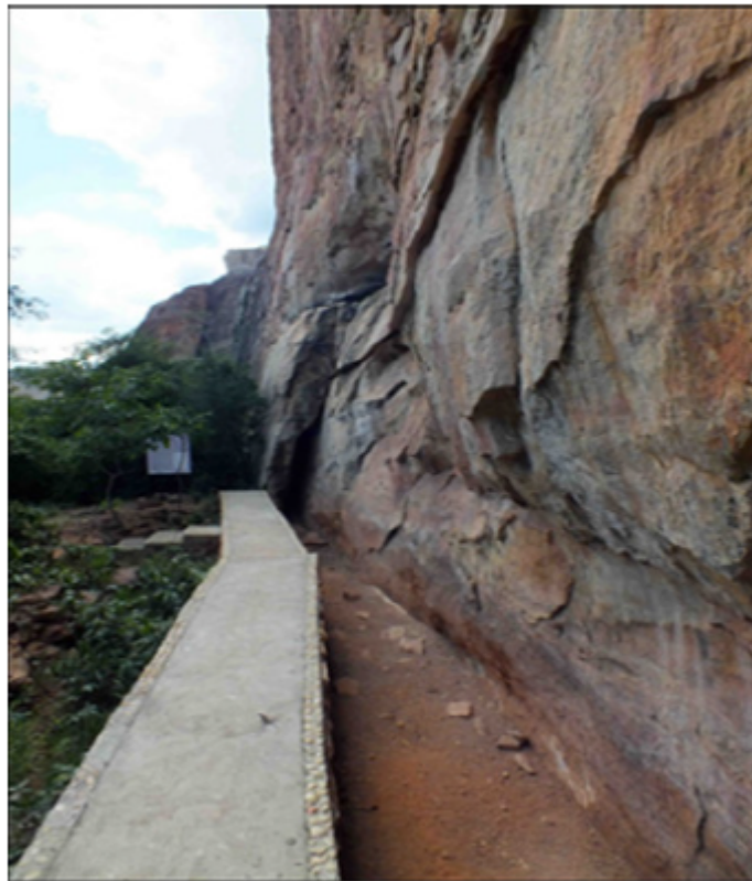
Figura 5. Toca dos Coqueiros.

Zuzu é um conjunto de crânio e ossos encontrados durante as escavações na Toca dos Coqueiros no Parque Nacional Serra da Capivara, possuindo uma morfologia africana e uma datação absoluta estimada de 9.870+-50 B.P. Zuzu que em num primeiro momento foi classificado como uma mulher, posteriormente, reclassificado como um homem, que destoa das morfologia mongoloide usualmente encontrados na região e sendo típicos dos índios brasileiro (Hubbe et al, 2007; Cunha, 2014).