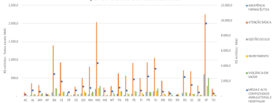
Gráfico com consolidação dos dados disponibilizados – Repasses Fundo a Fundo do Governo Federal por UF e Bloco de Financiamento