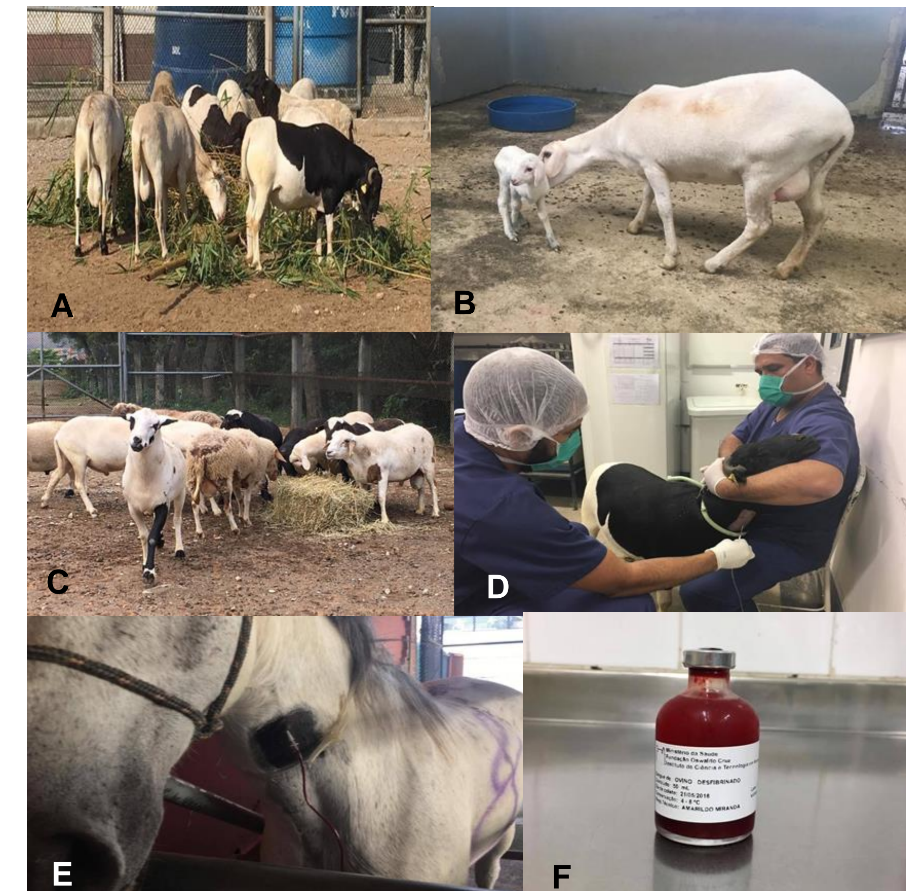
Figura 7. Em A , B e C , rebanho de ovinos dedicado à coleta de sangue. Em D , Coleta de sangue de ovinos e em E , de equino. Em F , frasco de sangue animal para fornecimento a pesquisadores da FioCruz.