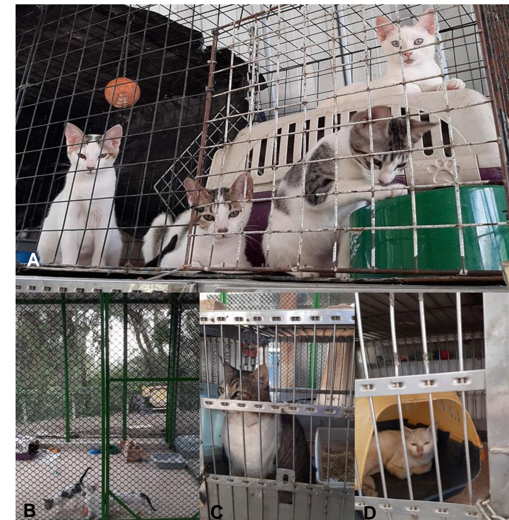
Figura 3. Espaço sendo construído acomodar gatos. Em A , 4 filhotes que foram encontrados e estão na gaiola para serem cuidados. Em B , parte desses filhotes em um espaço para aguardar a adoção. Em C , um gato quase totalmente recuperado de miase na cabeça. Em D , gato com FELV e que se encontra em tratamento.