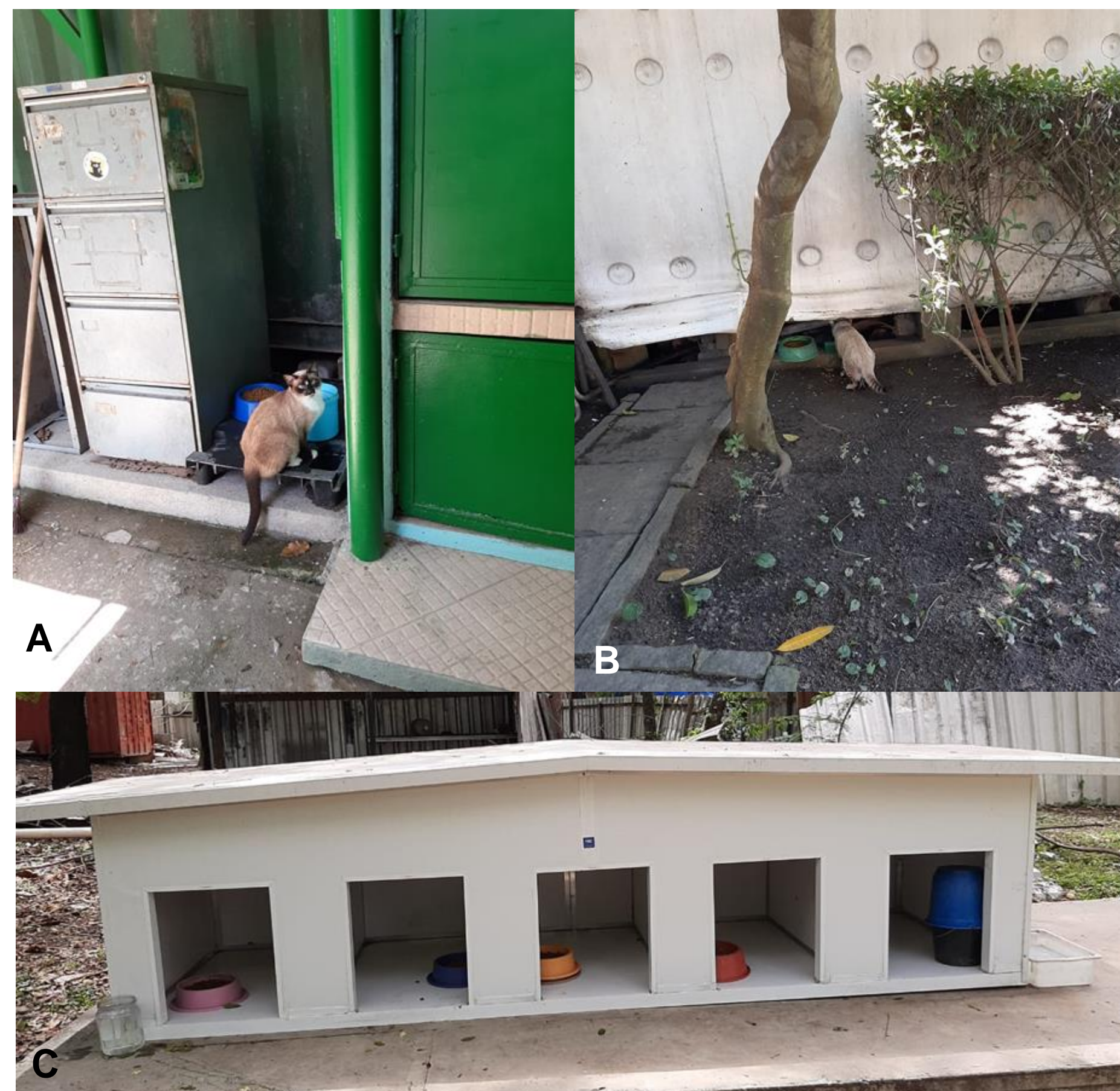
Figura 2. Estruturas utilizadas como abrigo por animais residentes no campus. Em A , animal utilizando estrutura de contêiner como abrigo; Em B , espaço abaixo de contêiner utilizado como abrigo e em C , abrigo construído para cães, com material excedente de construção predial.