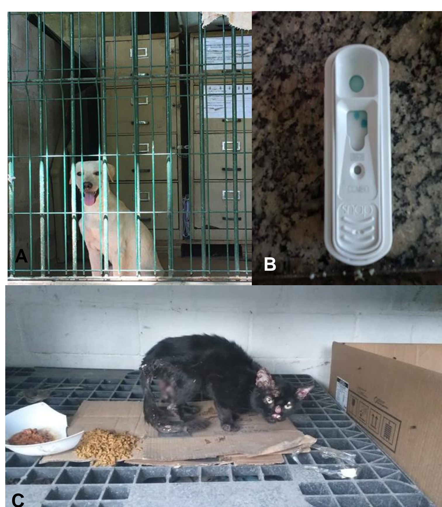
Figura 5. Em A , um cachorro sendo cuidado no campus da expansão. Em B , teste rápido de detecção de FIV/FELV. Em C , gato abandonado no campus em péssimas condições, tendo evoluído para óbito na data do resgate.