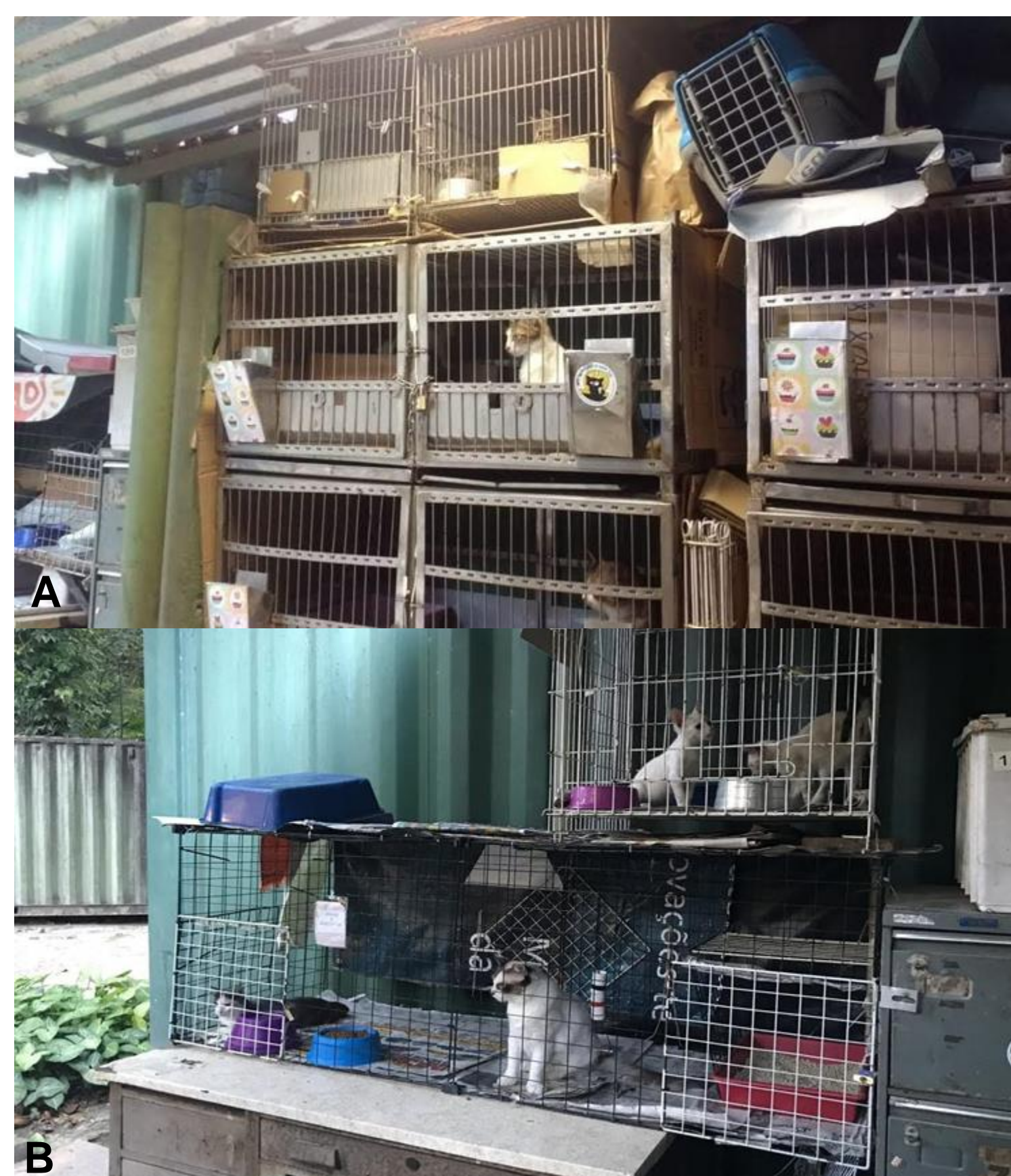
Figura 4. Espaço improvisado no IOC, montado por voluntários antes da existência de uma iniciativa institucional, com gaiolas para contenção de gatos sob cuidados veterinários ou em processo de busca de adoção. Os gatos de A e B estavam recebendo medicação.

Também fiquei por um tempo junto com uma médica veterinária no antigo SHDA, que é onde ficavam os animais de grande porte, como cavalos e ovelhas. Esses animais são usados para fornecer sangue para experimentos em laboratórios e para fabricação de meios de cultura. Estas coletas de sangue são feitas periodicamente com um espaço de tempo suficiente entre elas para os animais se recuperarem bem. Durante este período descobri que são inseridos microchips que contém uma numeração para esses animais serem identificados. Também acompanhei os cuidados de uma cabra que ficou doente depois de ter um filhote.