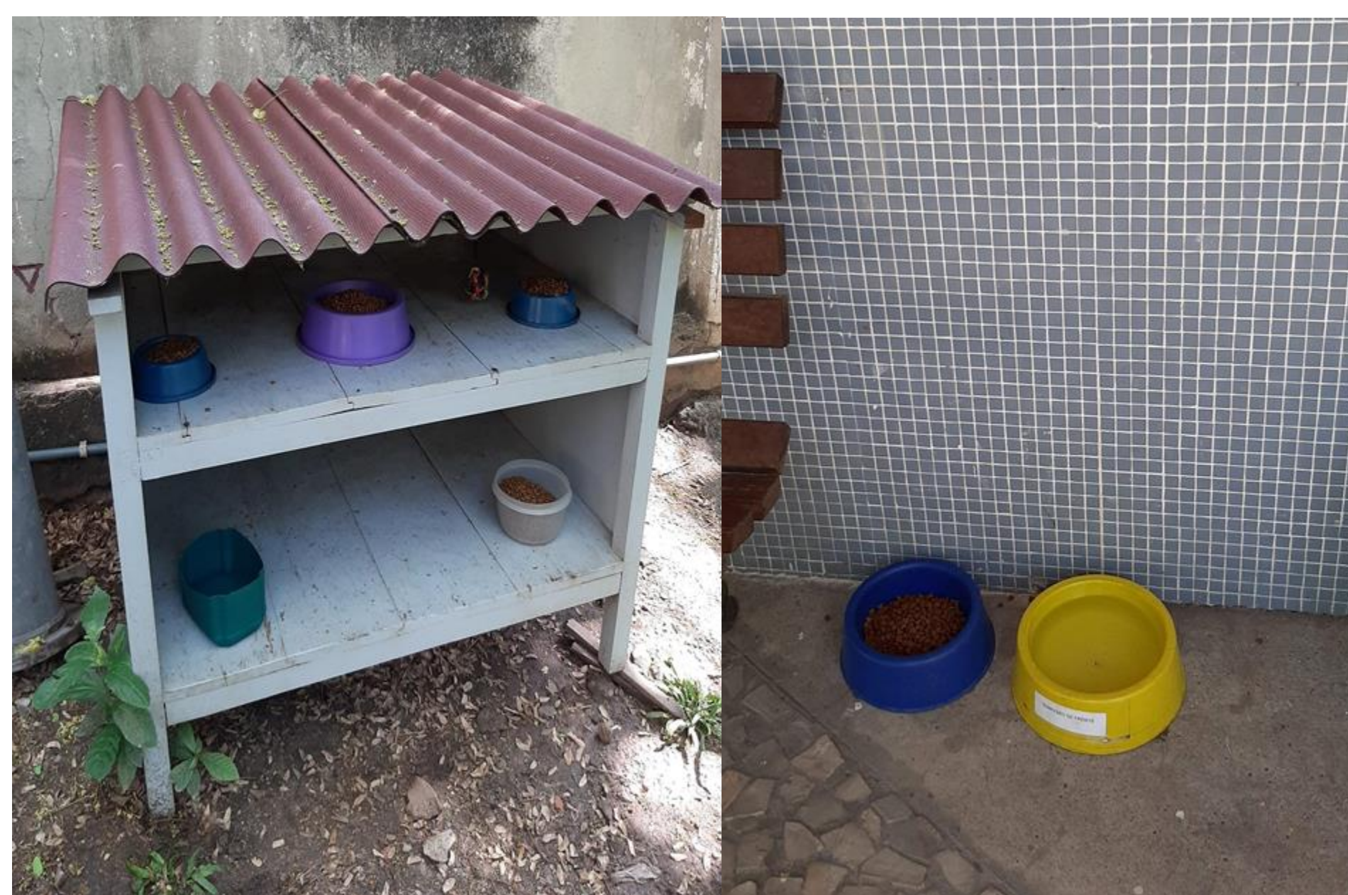
Figura 1. Alguns dos vários pontos de alimentação espalhados pelos campus. Nesses pontos tem água e ração de uma boa qualidade para os cachorros e gatos.

O conceito de Saúde Única estabelece que é impossível dissociar as saúdes humana, animal e ambiental, para que haja equilíbrio e bem-estar de todos. Baseando-se nesse conceito e nos riscos que um grande número de animais abandonados no campus poderia trazer, como a transmissão de zoonoses, acidentes automobilísticos, mordeduras ou arranhaduras, foi criado o "Programa Saúde Única no Campus", que tem como objetivo contribuir para um ambiente saudável para todos. Isto inclui prover cuidados básicos de saúde aos animais encontrados no campus e controlar o quantitativo de animais que habitam o campus de Manguinhos.