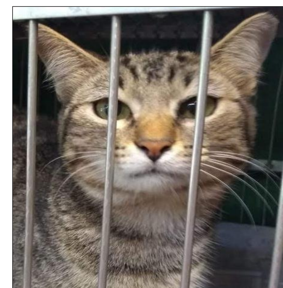
Figura 5. Gato encontrado no campus e mantido temporariamente em gaiola para tratamento veterinário.