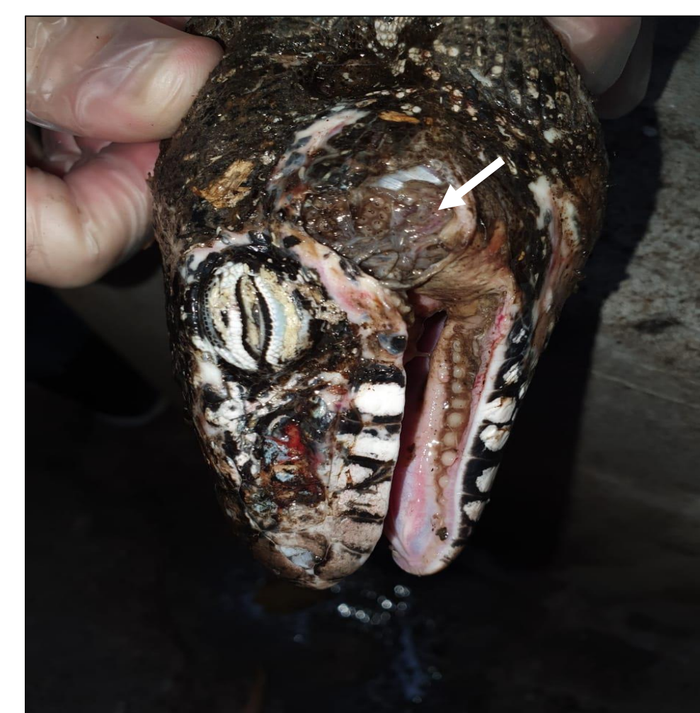
Figura 4. Lagarto Teiú encontrado no campus com diversas feridas contendo larvas de moscas (seta).