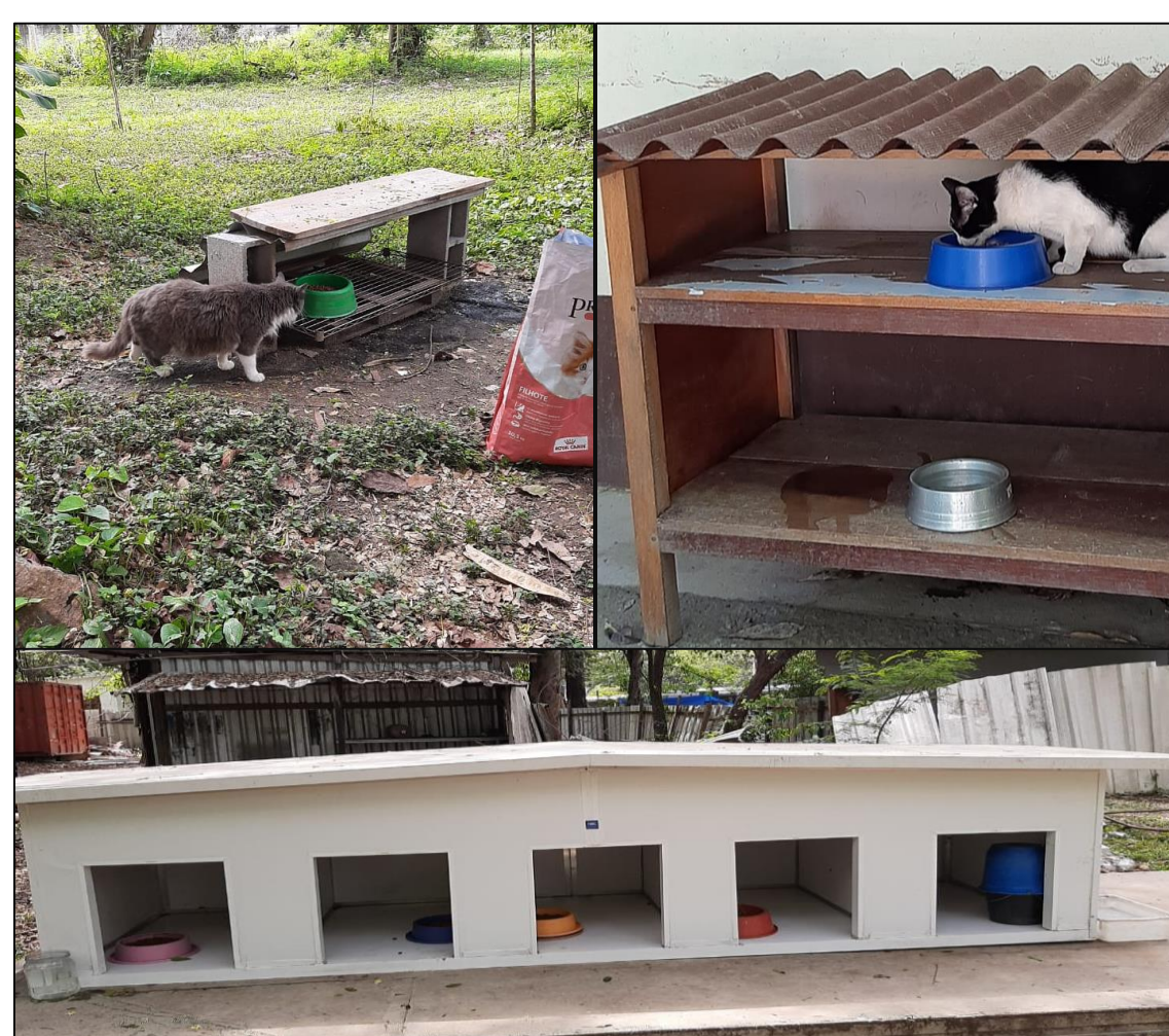
Figura 2. Pontos de alimentação para os animais domésticos abandonados na Fiocruz.