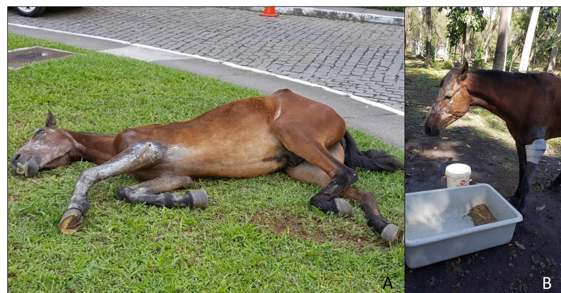
Figura 3. Cavalos abandonados no campus. Antes (A) e depois (B) de receber tratamento veterinário.