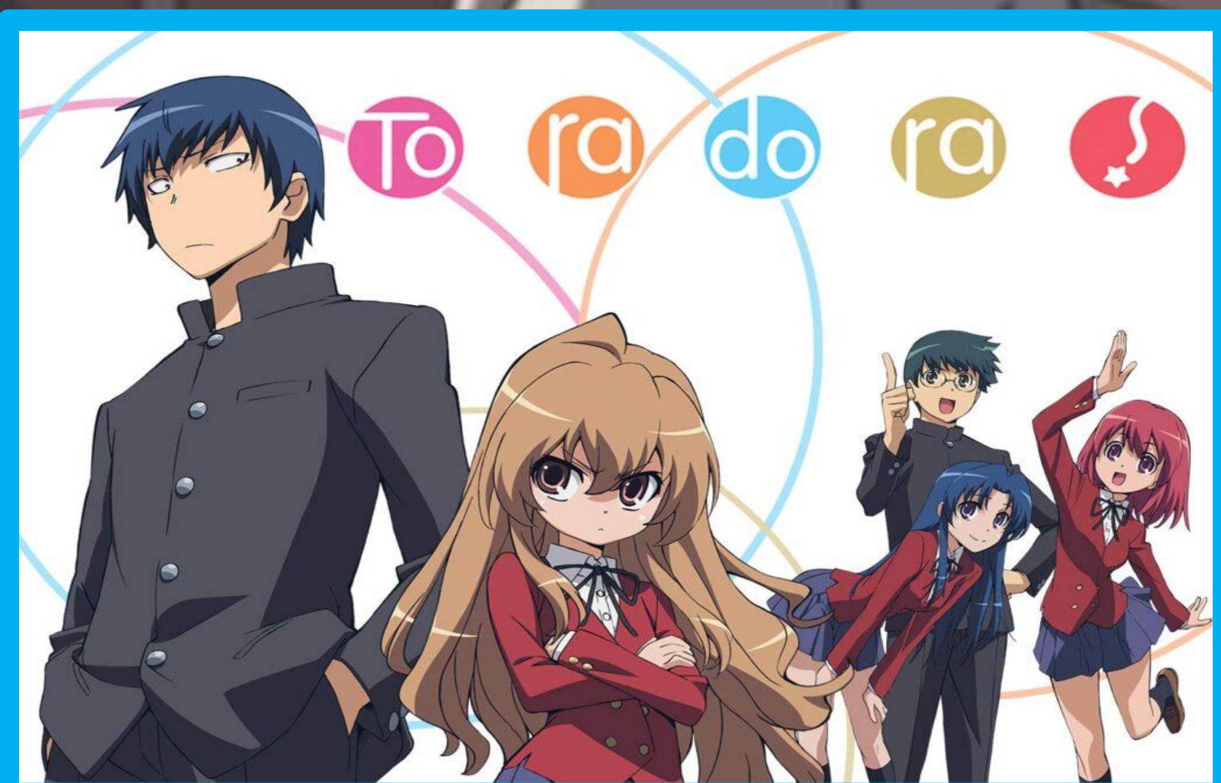
Capa do anime Toradora, um anime de vida escolar que retrata a vida de dois personagens com dificuldades e que acabam se ajudando e desenvolvem uma verdadeira trama adolescente

A partir dos dados colocados, concluímos que, diante do atual sistema educacional brasileiro, uma parceria estudantil entre as artes japonesas (animê e mangá) e o ensino é uma saída viável e objetiva para diminuir as brechas na comunicação que existe entre o aluno e o professor e colaborar para que o docente obtenha melhor aderência das matérias.