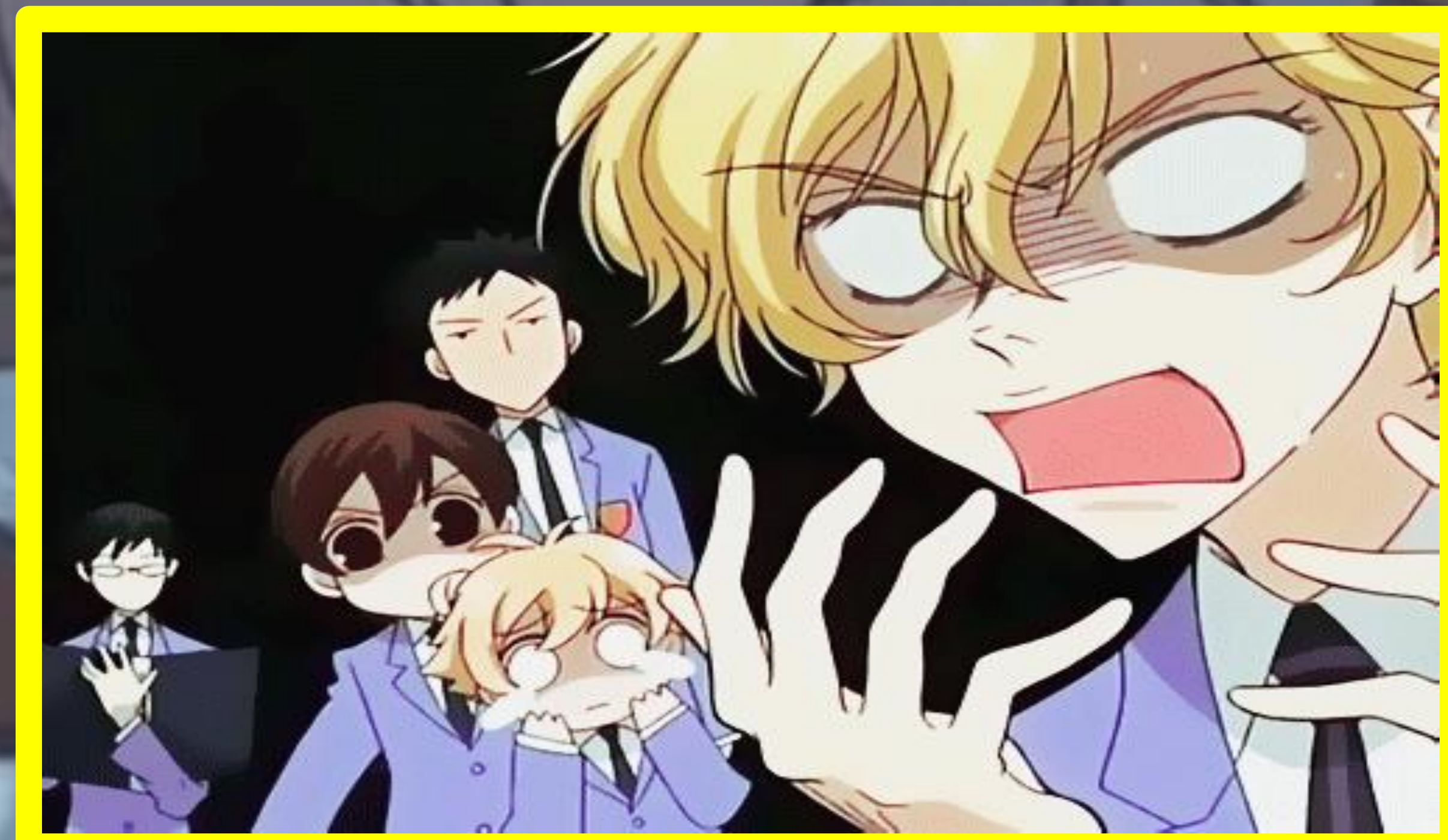
Essa imagem é do anime "Ouran High School Club", ela está retratando uma das grandes características dos animes que é o excesso de expressões, são muito marcantes.

https://pa1.narvii.com/6646/2dbd2c595653dad174aed738f597b815c2129a72_hq.gif