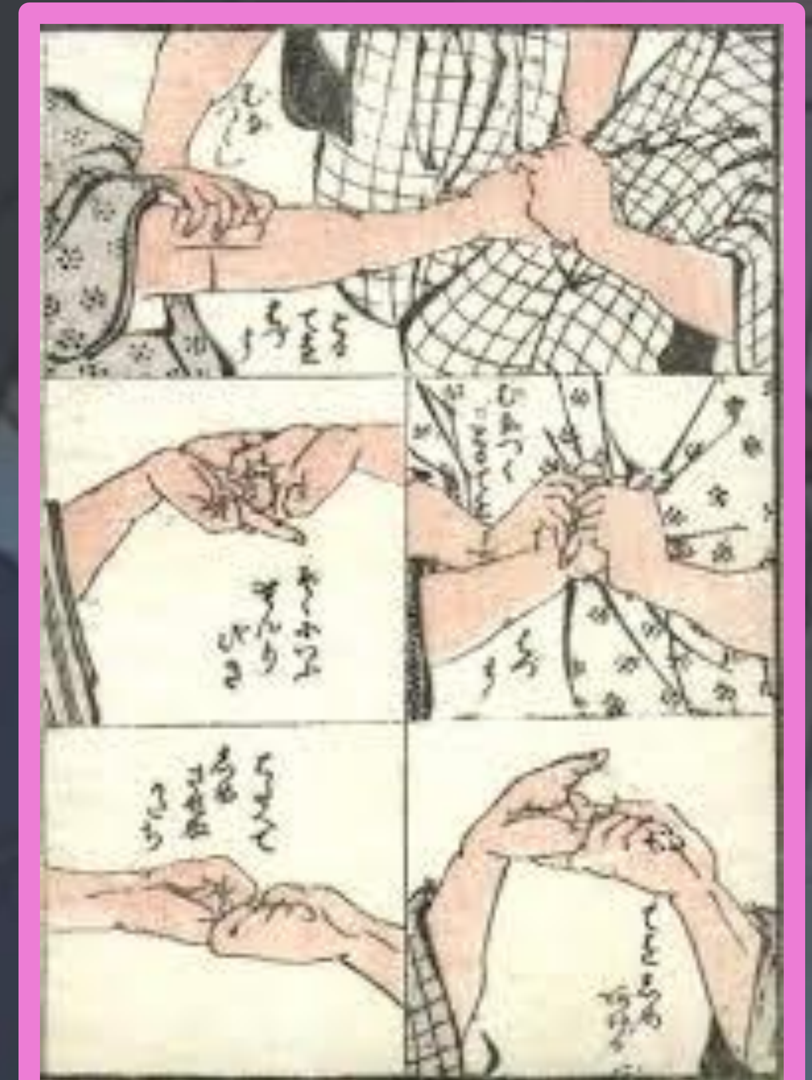
Está é uma imagem de como era o Mangá elaborado por Hokusai - 1760-1849, página extraída de Manga vol 8 técnicas de autodefesa.

https://pa1.narvii.com/6646/2dbd2c595653dad174aed738f597b815c2129a72_hq.gif