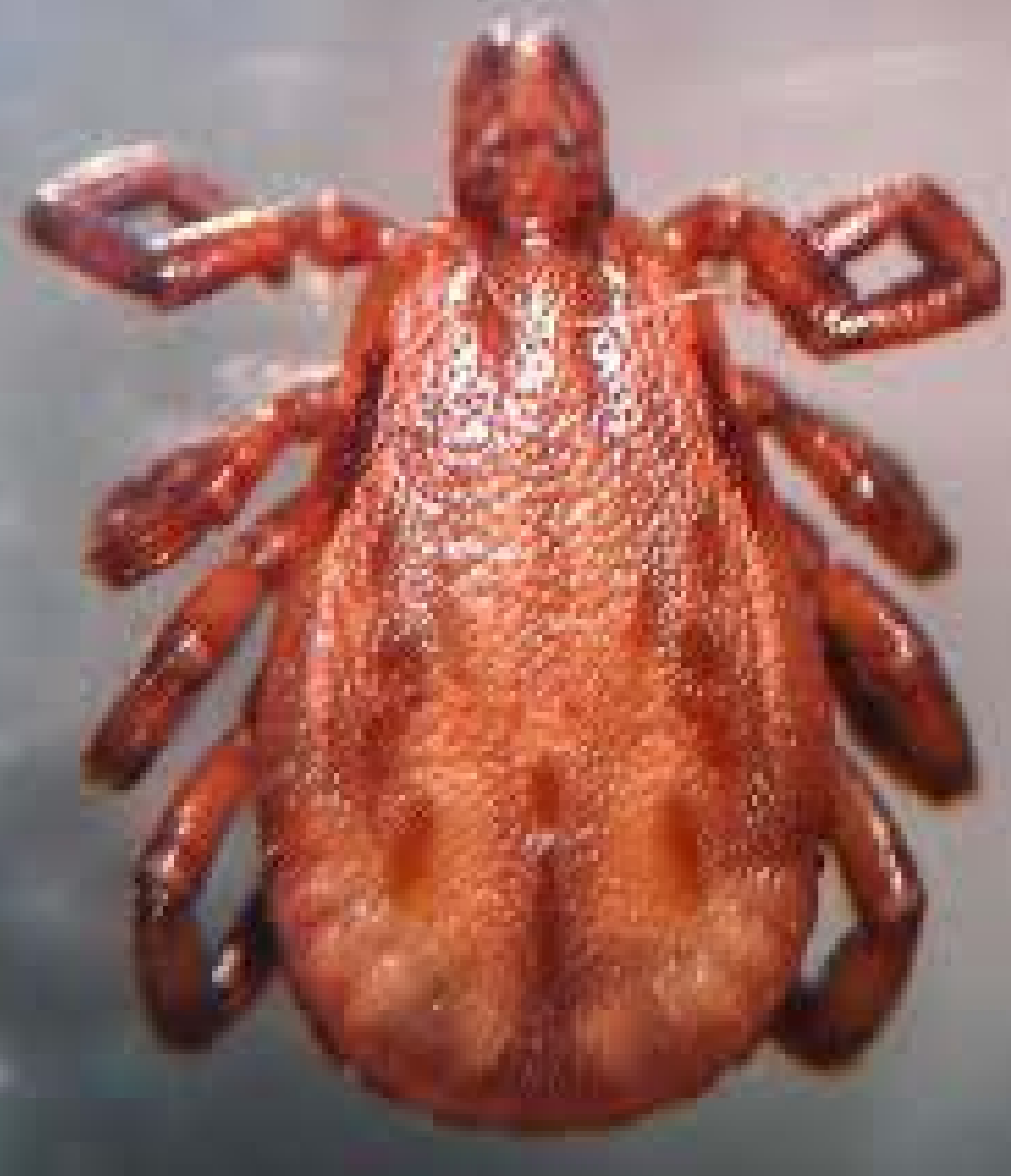
Amblyomma aureolatum. Vista dorsal e ventral

Coordenador do laboratório: Gilberto S. Gazeta – IOC/LIRN