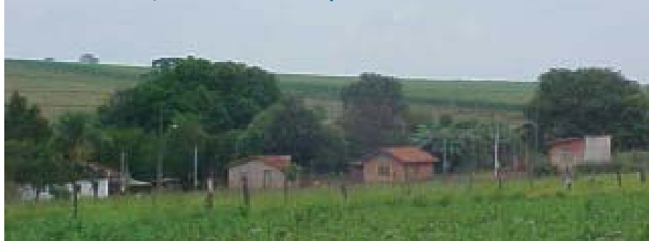
Quilombo do Jaó tem ACS formada pela ETSUS Osasco

No Espírito Santo, o Núcleo de Educação e Formação em Saúde, que oferece cursos nos 78 municípios do estado, usa a metodologia da problematização para discutir assuntos como o câncer de pele – comum nos agricultores descendentes de europeus, que trabalham o dia inteiro sob sol forte – e os problemas causados pela extração de mármore, granito e rochas. Segundo Naya Nunes, diretora da ETSUS, os cursos também valorizam a cultura local. “Temos populações de índios, quilombolas, descendentes de alemães, italianos, além dos pomeranos, que são descendentes de prussios e quase não falam português. Tentamos abordar todas as especificidades culturais desses grupos nos cursos da Escola”, explica Naya. ■