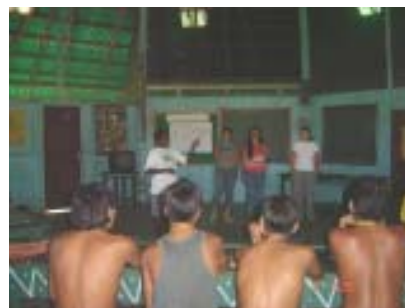
AIS recebem acompanhamento pedagógico da ETSUS Roraima

Nos dias 7, 8 e 9 de novembro, técnicos da Escola de Saúde Pública do SUS em Roraima participaram do curso de Capacitação para Conselheiros Indígenas de Saúde, realizado pela Funasa. A ETSUS foi convidada por estar envolvida no processo de formação e certificação dos Agentes Indígenas de Saúde e ser membro do Conselho Distrital. “Esse evento é de extrema importância, pois propiciou o entendimento das responsabilidades dos conselheiros, além de melhor compreensão da Política Nacional de Saúde para os Povos Indígenas”, afirmou a direção da Escola.