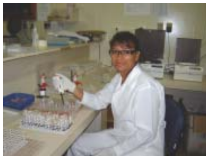
Aluna na aula do curso de Patologia Clínica

Também em dezembro, a ETSUS termina 12 turmas, com um total de 265 alunos, do curso técnico