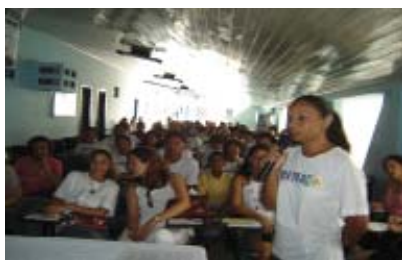
Apresentação de Seminário pela ACS da ETSUS

dias 28 e 29 de agosto, os ACS que encerraram a primeira etapa do curso apresentaram seus trabalhos de conclusão em forma de seminário. Os temas mais abordados foram os relacionados a Direitos Humanos, Atenção Básica em Saúde e Políticas Públicas em Saúde.