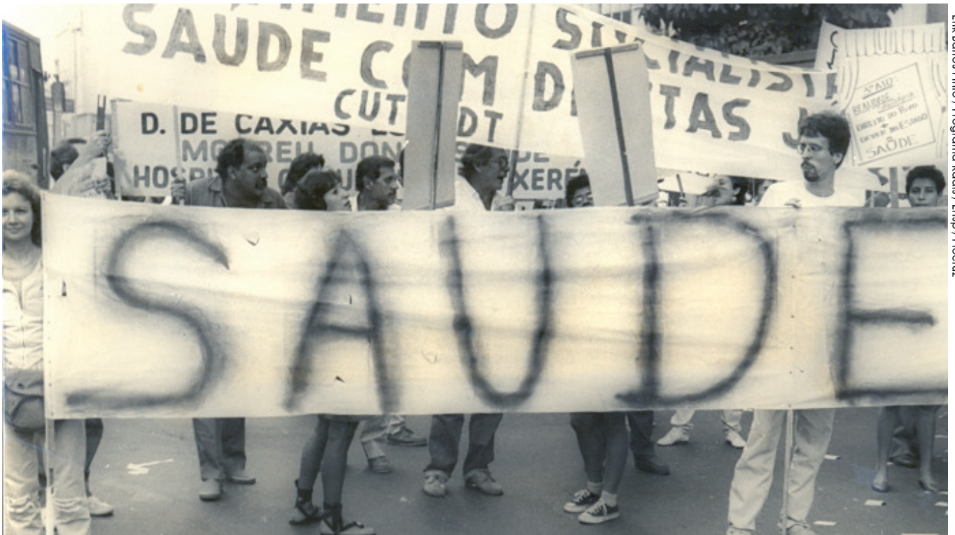
Passeada por uma nova Constituição Federal

Reivindicações sociais durante a ditadura apontam a necessidade de redemocratização