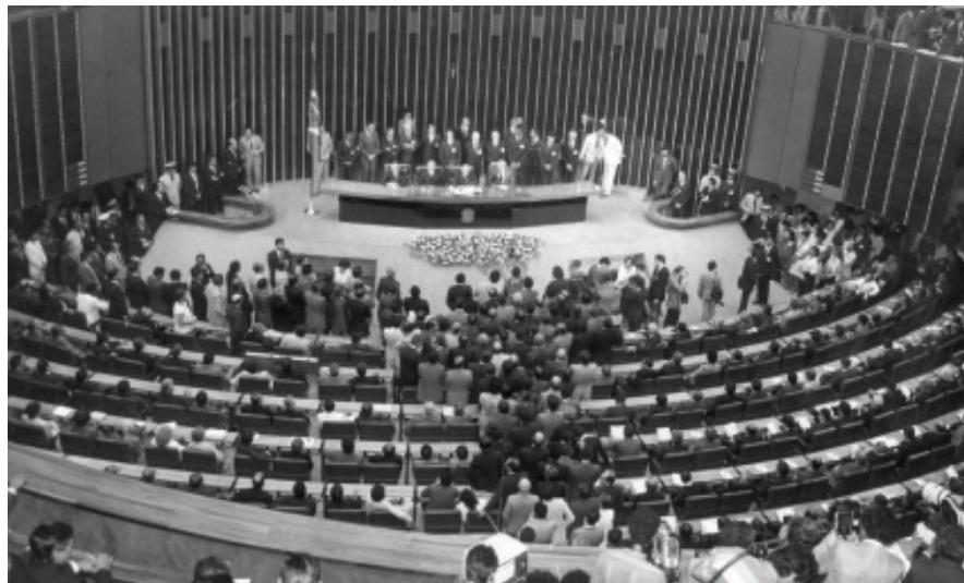
Câmara dos Deputados

Constituição Federal prevê a formação de sociedade preparada para o exercício da cidadania