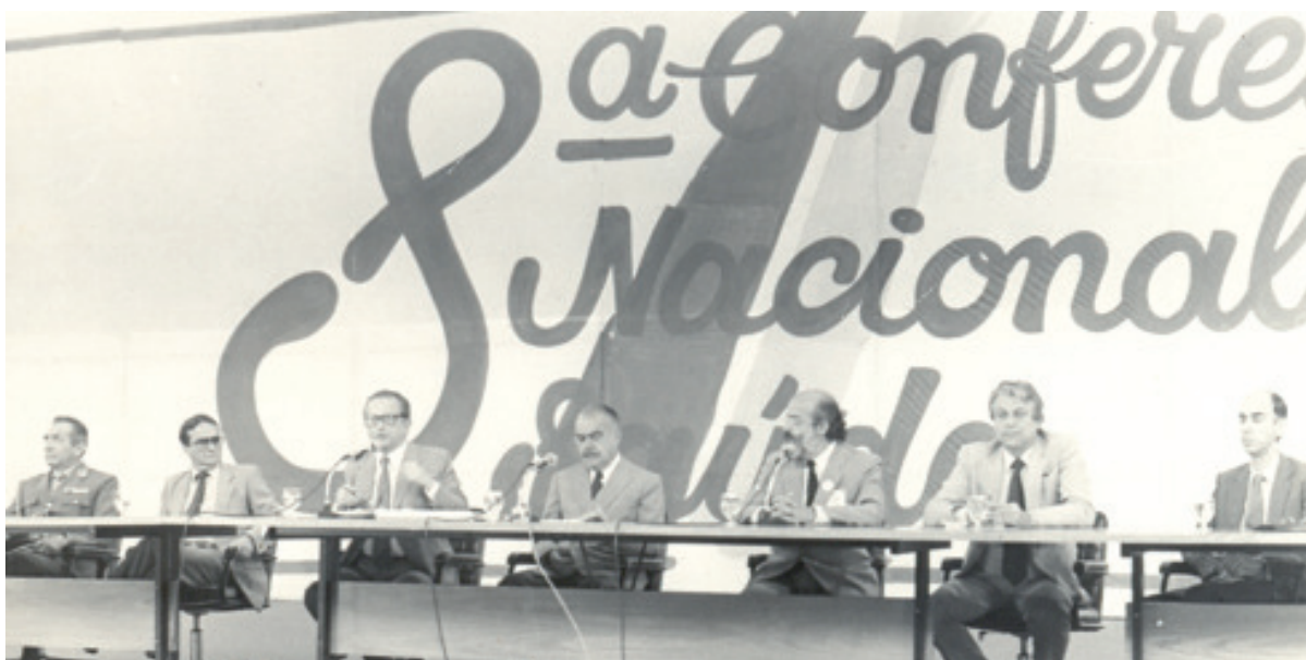
Programa Rádios / 1986 / Alvaro Pedreira