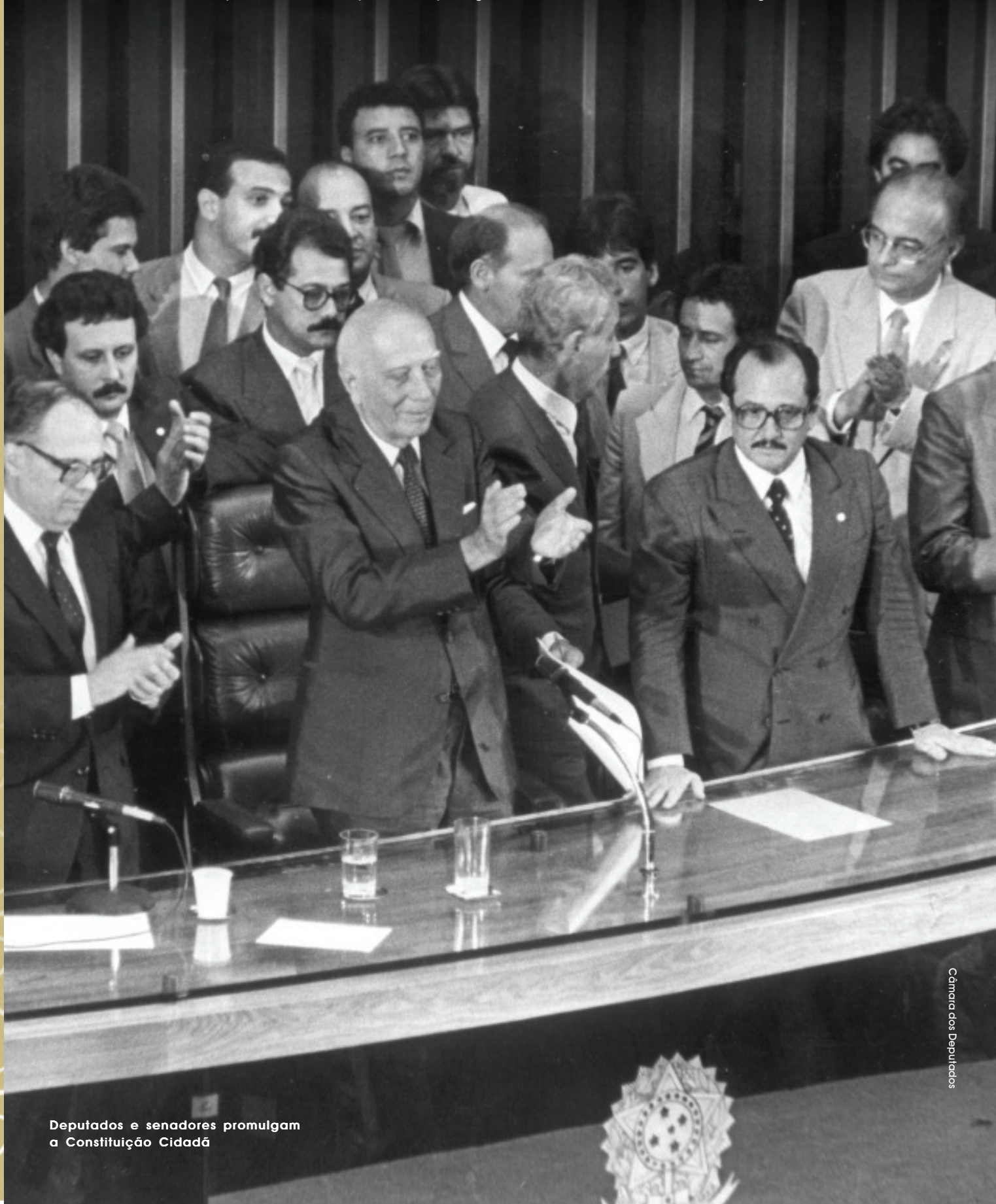
Deputados e senadores promulgam a Constituição Cidadã

Democracia permite a participação social na elaboração do texto