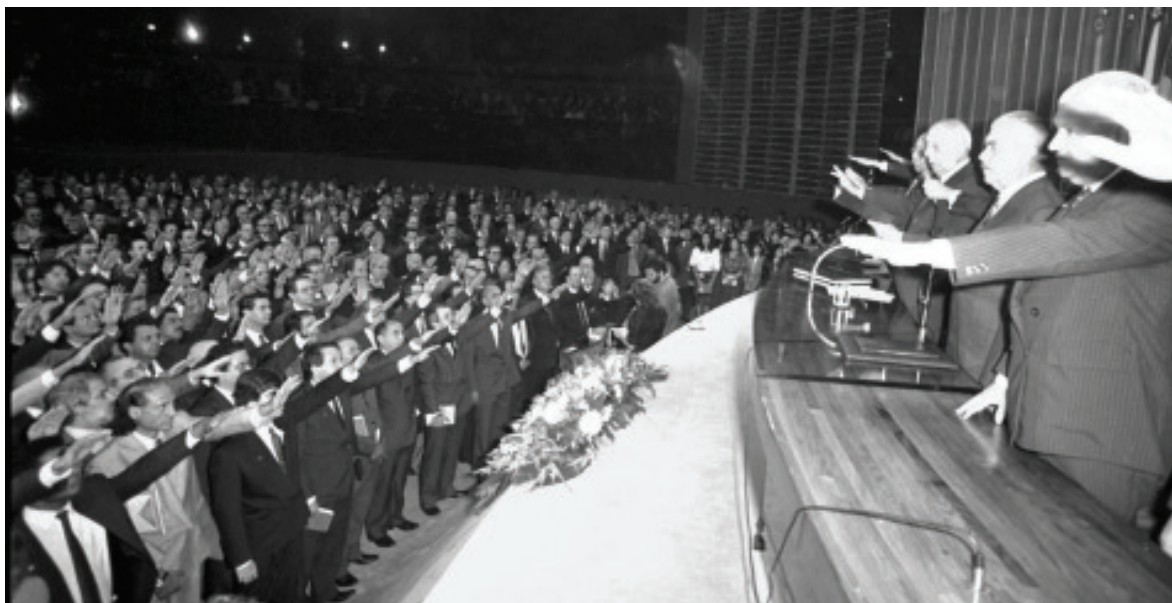
Câmara dos Deputados