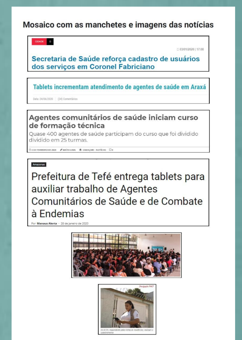
Figura 4. Mosaico com as manchetes e imagens das notícias

O uso dos tablets aparece como extrema importância, pois agiliza bastante o trabalho com o fato de não ter que transcrever todas as informações de cadastramento de usuários a mão e ainda ter que transferir para outro profissional realizar o processo de digitação.