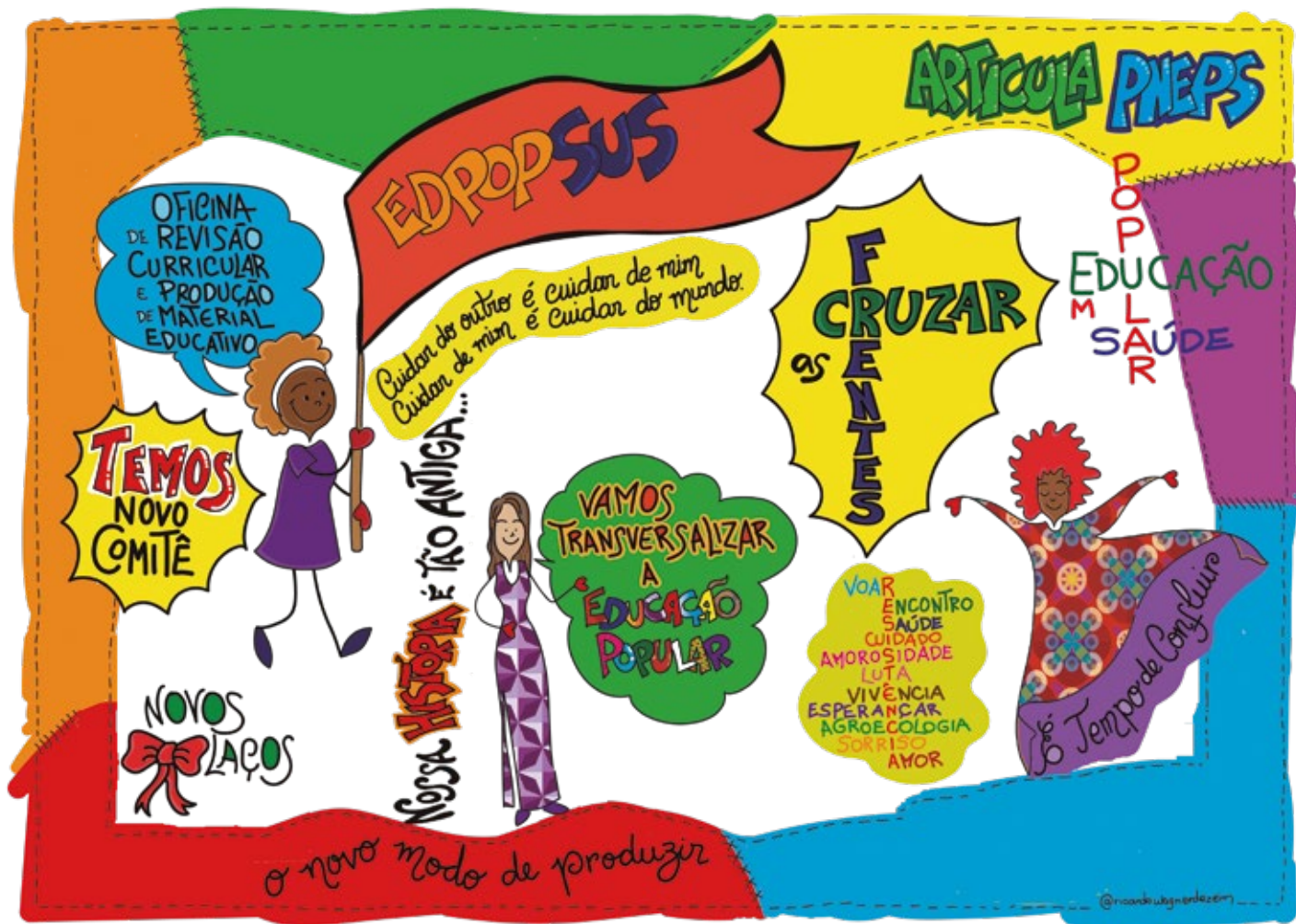
EdPopSUS - Currículo ilustrado