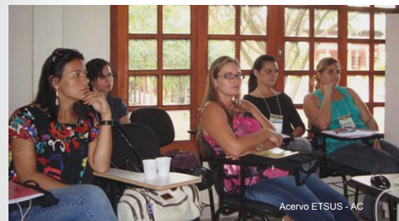
Acervo ETSUS - AC

A formação foi fruto de uma parceria entre o Conselho de Secretarias Municipais de Saúde (Cosems/AC), o Conselho Estadual de Saúde do Acre e o Instituto Dom Moacyr, autarquia estadual a qual a ETSUS está vinculada.