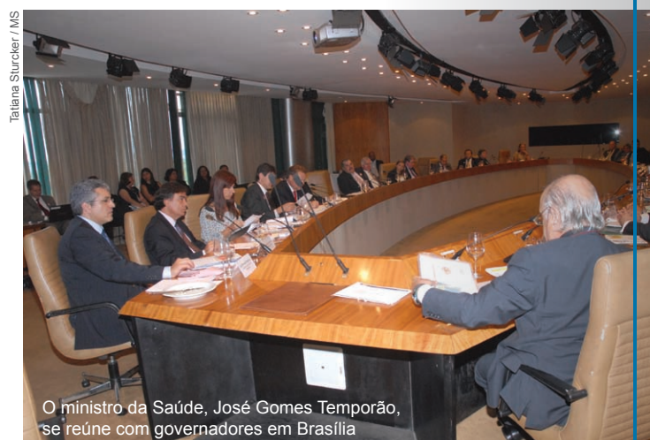
O ministro da Saúde, José Gomes Temporão, se reúne com governadores em Brasília

Nas UTIs neonatais (UTIN) serão 1.251 profissionais qualificados – 84 já finalizaram o curso e 212 estão em processo. Os eixos trabalhados são a admissão do recém-nascido de risco, o cuidado humanizado ao recém-nascido de risco e sua família, o monitoramento do bebê de risco, problemas respiratórios e oxigenoterapia, terapia intravenosa, alimentação e aleitamento materno.