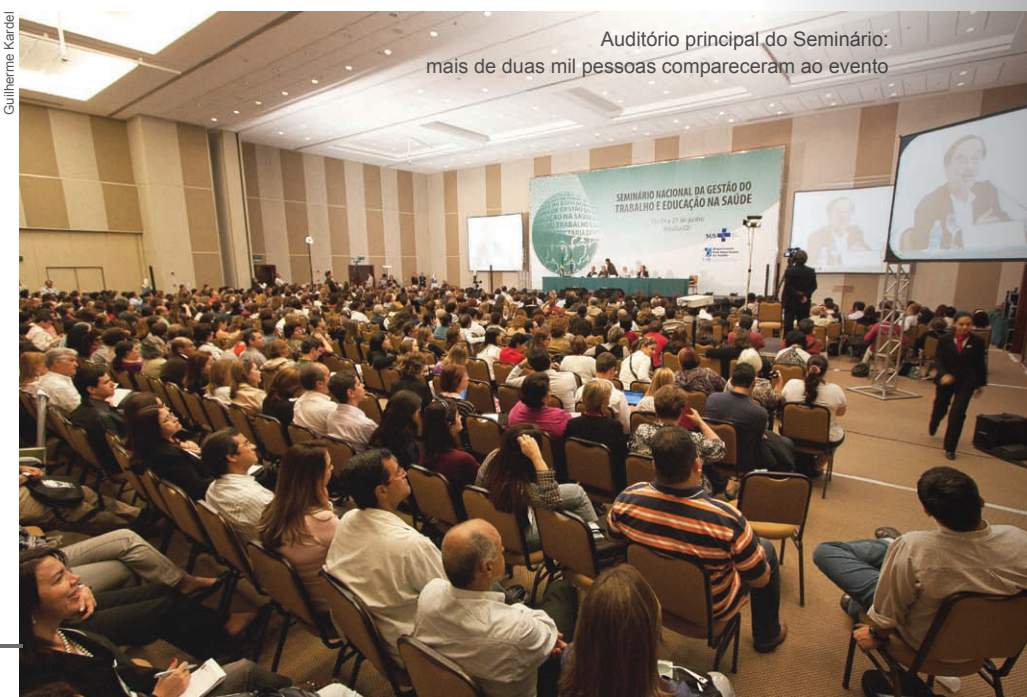
Auditório principal do Seminário: mais de duas mil pessoas compareceram ao evento

Entre as metas a curto, médio e longo prazo da Escola estão a qualificação da equipe gestora, técnica e docente com especialização, mestrado e doutorado, a implantação de novas turmas e cursos e a transformação da ETSUS em Escola de Saúde Pública. ■