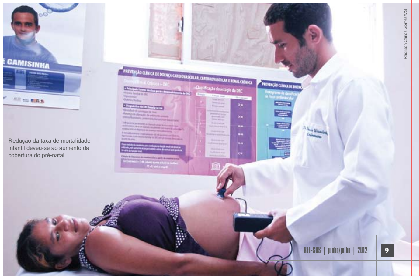
Redução da taxa de mortalidade infantil deve-se ao aumento da cobertura do pré-natal.