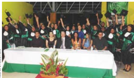
Acervo ETSUS Acre

A Escola Técnica em Saúde Maria Moreira da Rocha, no Acre (ETUS-AC), vinculada ao Instituto de Desenvolvimento da Educação Profissional Dom Moacyr, que por sua vez está ligado à Secretaria de Estado da Educação, realizou a formatura de 58 alunos do curso de Auxiliar em Saúde Bucal no dia 20 de julho. Os formandos fizeram parte das primeiras turmas na área da Saúde destinadas aos jovens e trabalhadores das comunidades de Rio Branco, capital do estado, ainda não inseridos no mercado de trabalho. Iniciado em fevereiro de 2011, com uma carga horária de 828 horas, contemplando atividades teóricas e práticas, e com recursos do Governo do Estado do Acre, o curso contou com a participação de diversos mediadores, entre eles cirurgiões-dentistas, enfermeiros e nutricionistas, e com o acompanhamento efetivo da área de aprendizagem da escola.