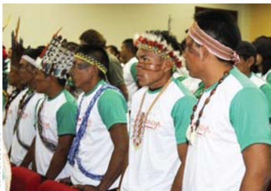
Acervo ETSUS Acre

O governo do estado do Acre, em parceria com o Ministério da Saúde, lançou, no dia 24 de julho, o Programa de Formação de Trabalhadores em Saúde do Acre. A proposta é formar e qualificar mais de 900 trabalhadores, através da Escola Técnica em Saúde Maria Moreira da Rocha (ETSUS-AC), vinculada ao Instituto Dom Moacyr — por sua vez, ligado à Secretaria de Estado da Educação. O programa conta com recursos do Programa de Formação de Profissionais de Nível Médio para a Saúde (Profaps), do Ministério da Saúde, e de Educação Permanente em Saúde do Acre (PEP).