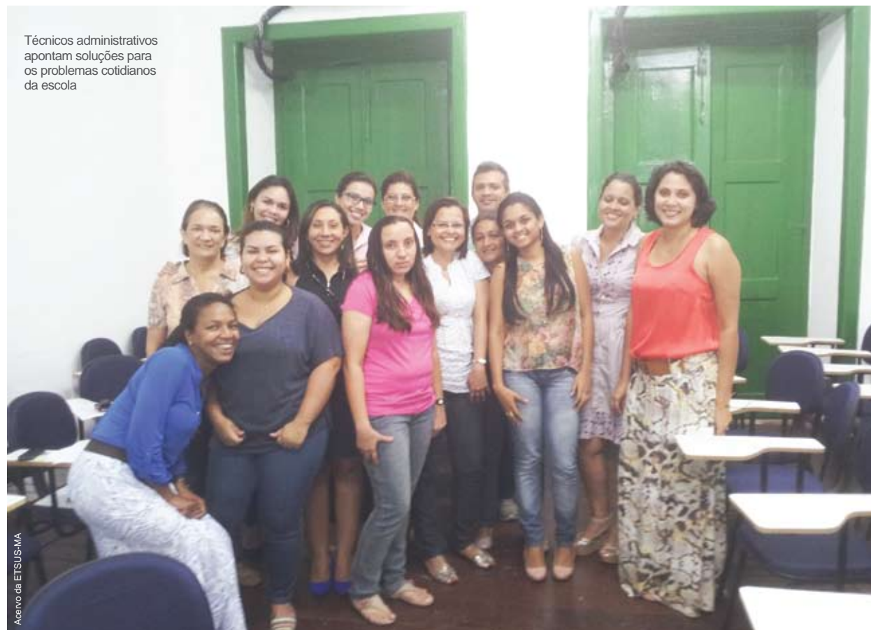
Técnicos administrativos apontam soluções para os problemas cotidianos da escola