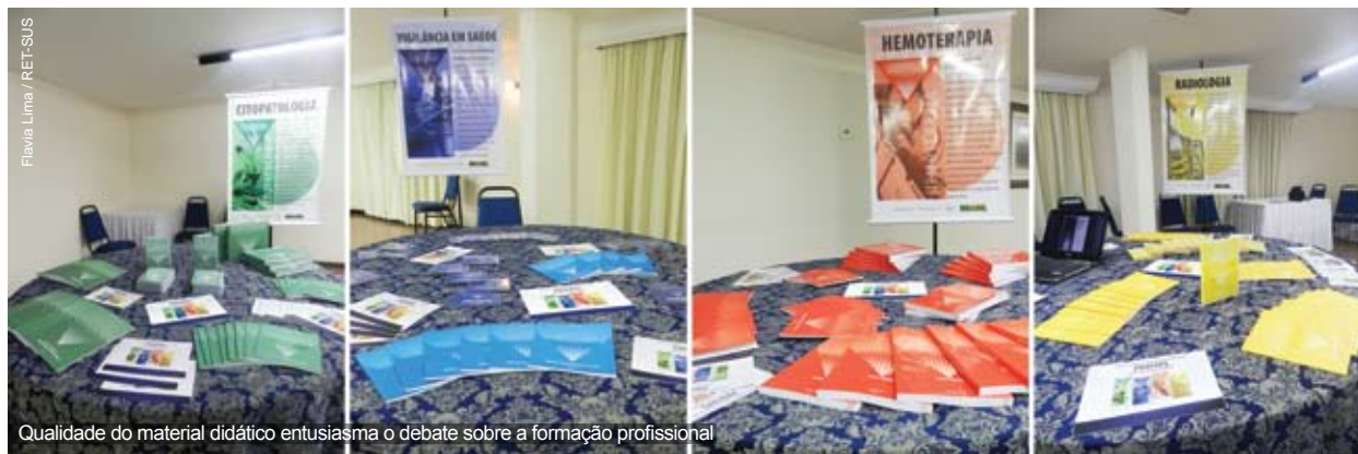
Qualidade do material didático entusiasma o debate sobre a formação profissional

gestão e da operacionalização financeira dos recursos do Profaps; e a articulação entre os conselhos estaduais de educação e as ETSUS no processo formativo. O evento foi precedido pelo lançamento de uma coletânea de material didático das áreas técnicas de Citopatologia, Hemoterapia, Vigilância em Saúde e Radioterapia. As publicações e DVDs que compõe a coletânea fizeram parte de uma iniciativa inédita, na qual o MS investiu R$ 5,5 milhões.