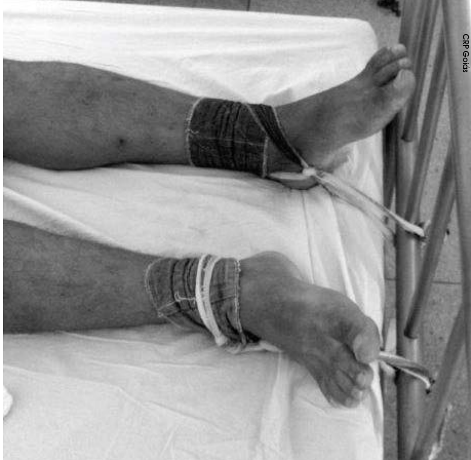
Cena flagrada pela Comissão Nacional de Direitos Humanos do Conselho Federal de Psicologia em um dos 68 locais de internação para usuários de drogas inspecionados

O coordenador de Saúde Mental do Ministério da Saúde concorda que o problema do crack é muito mais complexo. Para ele, a discussão polêmica sobre para onde devem ir os usuários de crack deve ser um debate sobre o papel dessas pessoas na sociedade. “O desenvolvimento econômico está deixando para trás uma parcela significativa de brasileiros. Então, trata-se de um problema sobre que lugar na socie-