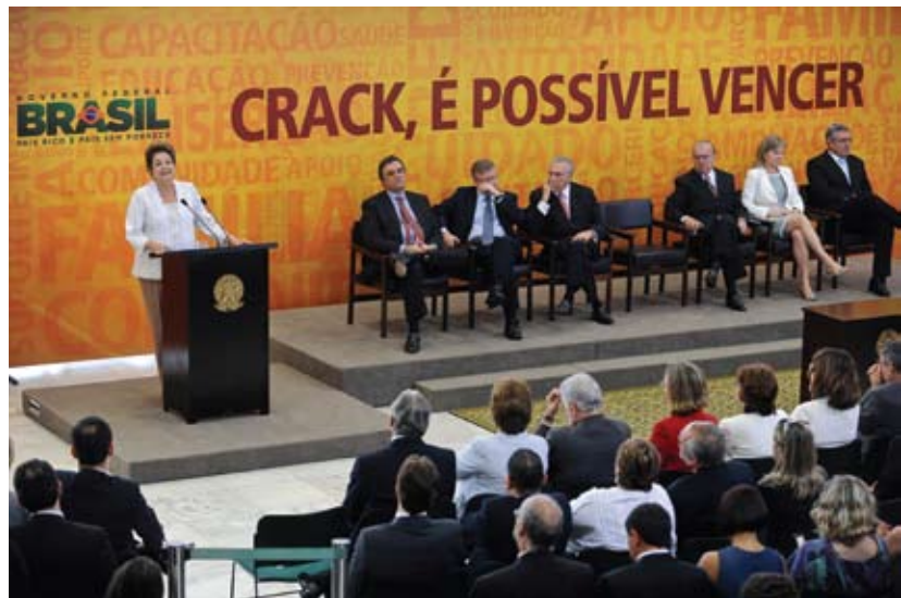
Presidente Dilma lança o Plano de Enfrentamento ao uso do Crack em Brasília.

O “Relatório da 4ª Inspeção Nacional de Direitos Humanos: locais de internação para usuários de drogas” está disponível em www.pol.org.br