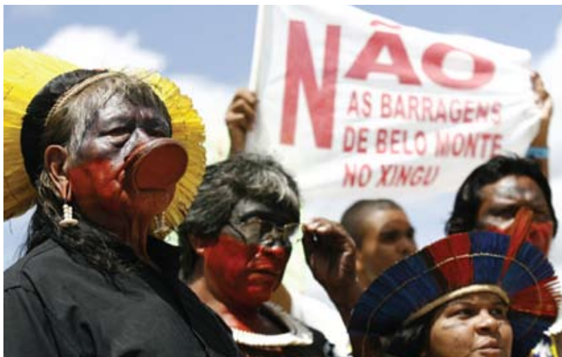
Indígenas em protesto contra Hidrelétrica de Belo Monte – uma das experiências de resistência atuais que farão convergência na Cúpula dos Povos

O slogan da Cúpula dos Povos é 'Venha reinventar o mundo!'. Segundo o comitê organizador do evento, as corporações não terão espaço no local onde ocorrerão as atividades. Inclusive, estão sendo pensadas soluções como a compra direta de alimentos da agricultura familiar para a alimentação dos participantes. As experiências brasileiras e de outros países que já apontam para outro modelo de desenvolvimento serão apresentadas na Cúpula dos Povos. “Nós queremos mostrar que é possível organizar outro tipo de sociedade que será muito melhor do que essa que está destruindo as condições de sobrevivência da humanidade na terra. Há exemplos concretos em todos os países do mundo, seja na agricultura com agroecologia, na construção de casas e de edifícios, na geração de energia. Por exemplo, toda a tecnologia da convivência com o semi-árido aqui no Brasil, que mostra que não precisamos transpor o Rio São Francisco. Queremos mostrar que embora essas experiências ainda sejam localizadas, elas podem ser difundidas”, diz Ivo Lesbaupin. ●