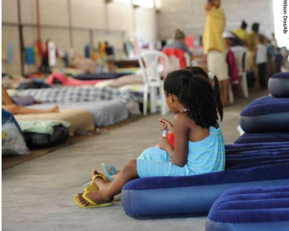
Cerca de 13 mil pessoas ficaram desabrigadas após desastres na região serrana do Rio.

Na área de prevenção de desastres, a persistência da lógica tecnocrática traduz-se no gosto pelas obras de grande porte. Isso, aliado à facilidade na liberação de recursos por ocasião de desastres, enseja, segundo Norma, o mau uso do dinheiro público e a corrupção. “A cada vez que é decretada situação de emergência em um município, ele opera em estado de excepcionalidade, ou seja, as obras não precisam de licitação e os atos públicos são menos fiscalizados”, explica. Assim, cria-se uma indústria associada aos desastres: “Com a construção de pontes superfaturadas,